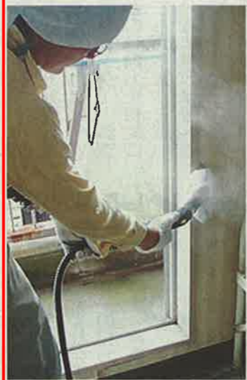
蒸気を隙間に当て、トコジラミを熱によって駆除する業者