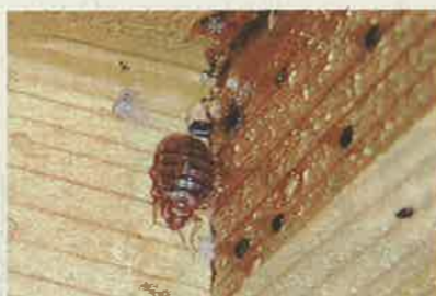
障子の敷居の隅に潜むトコジラミ。黒いふんが周囲に付着しているのが特徴

ある日、購読していた英字紙に、米国のトコジラミ被害を伝える記事があり、戦後、DDTなどの殺虫剤散布による駆除が進み、1970年代以降、ほとんど見られなくなった。ところが、世界規模で人の交流や物流が活発になったことで、長い間被害のなかった米国で2000年ごろから急速に被害が拡大。日本でも、宿泊施設などで被害が報告されるようになった。スーツケースの車輪の隙間やバッグの縫い目などに潜み、海外などから日本に入ってきたとみられる。東京都の保健所に寄せられたトコジラミに関する相談件数も2006年度以降、急増している(表参照)。